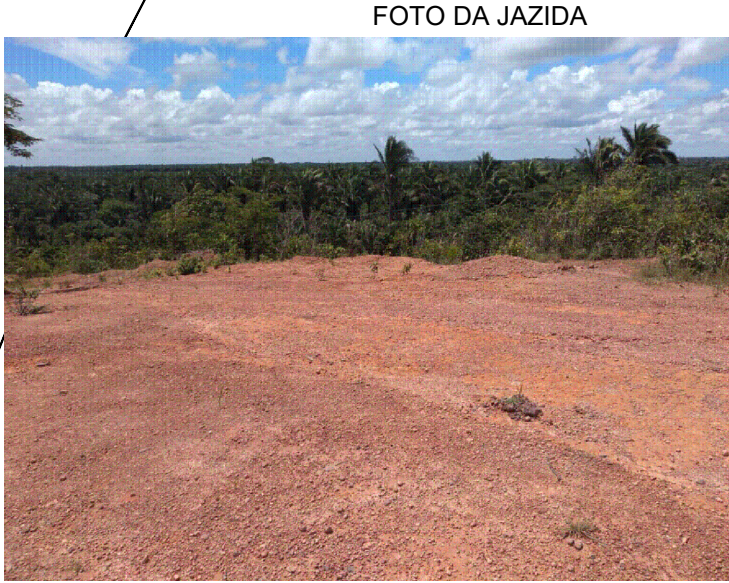
LOCALIZAÇÃO DA JAZIDA